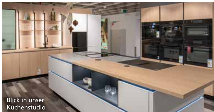
Blick in unser Küchenstudio