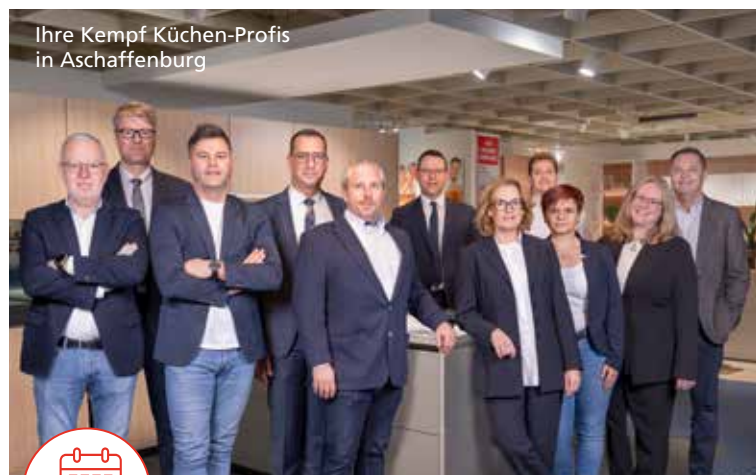
Ihre Kempf Küchen-Profis in Aschaffenburg