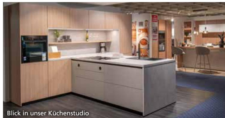
Blick in unser Küchenstudio

Entdecken Sie unsere große Auswahl an Küchengeräten und Küchenprogrammen verschiedener Hersteller.