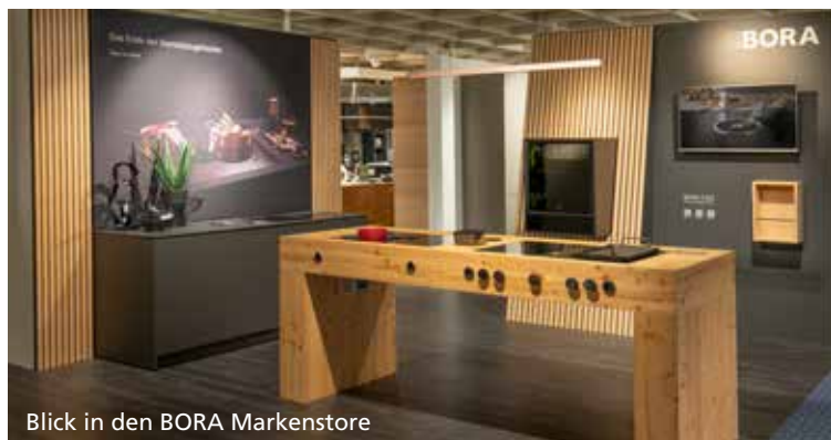
Blick in den BORA Markenstore