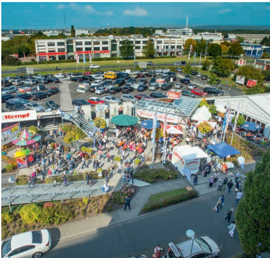
Oktoberfest in Aschaffenburg 2017