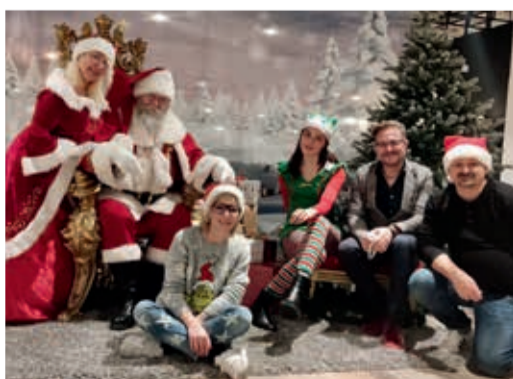
Nikolaus Aschaffenburg 2022

Und apropos bescheren! Für die Kinder ist in jedem Jahr die Nikolausaktion wohl das schönste Highlight – ein Bild mit dem Nikolaus bleibt etwas ganz besonderes. Und wenn es dann noch ein bisschen Schokolade aus dem mysteriösen Geschenktasche gibt, leuchten die Kinderaugen gleich doppelt! Als Familienunternehmen ist das auch für uns ein Event, das uns große Freude bereitet. Deshalb findet unsere Fotoaktion mit dem Nikolaus auch sowohl in Aschaffenburg als auch in Bad König jedes Jahr statt.