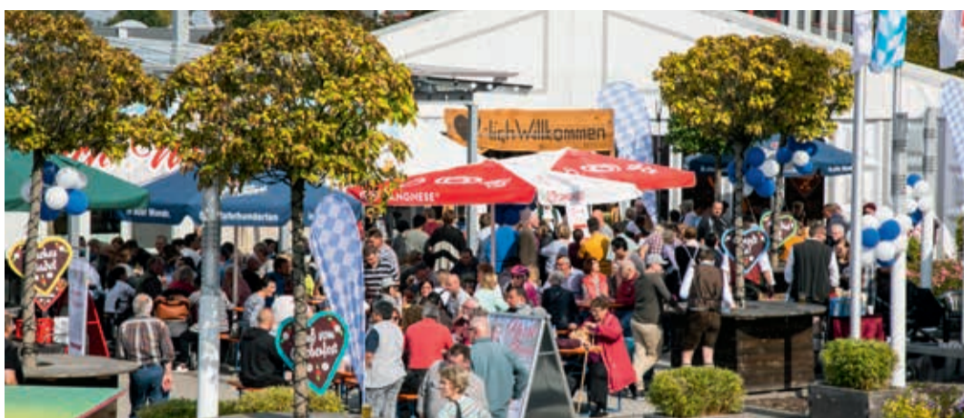
Oktoberfest in Aschaffenburg 2017