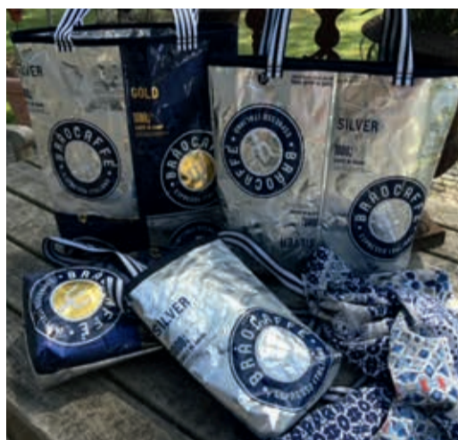
Handtaschen aus verbrauchten Kaffeeverpackungen

Der Stand von Energetix Magnetschmuck lädt ebenfalls zum Stöbern ein. Lassen Sie sich zu dem individuellen Schmuck direkt vor Ort von Energetix beraten um passende Produkte zu finden.