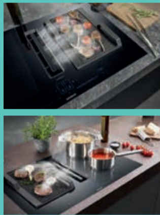
Die BSH Gruppe ist eine Markenlizenznehmerin der Siemens AG.

Schnelle Änderung der Leistungsstufe beim Kochen nur durch Bewegen des Kochgeschirrs.