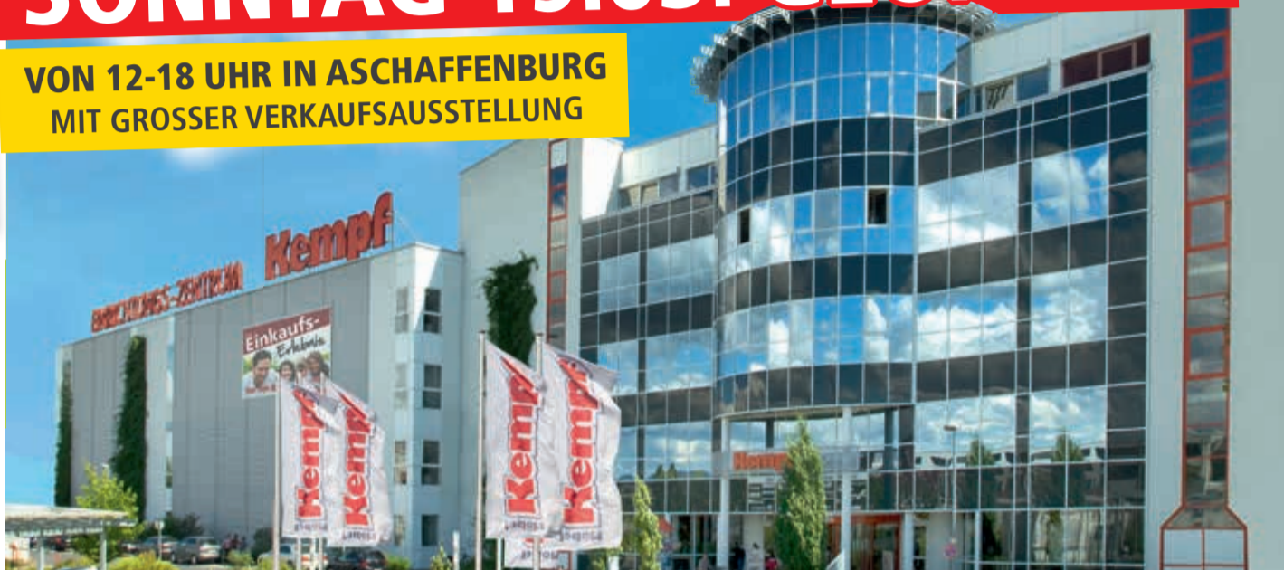
Möbel Kempf Einrichtungszentrum in Aschaffenburg/Nilkheim

VON 12-18 UHR IN ASCHAFFENBURG MIT GROSSER VERKAUFS-AUSSTELLUNG