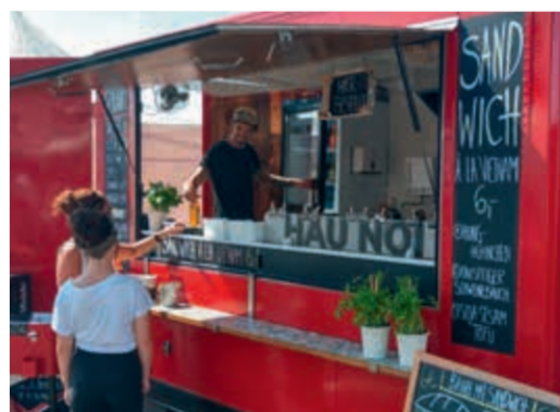
StreetFood Festival Aschaffenburg 2019