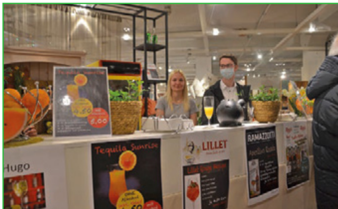
Leckere Getränke gibt es an der Soft- und Cocktailbar.

Zwischendurch kann man sich an der Cocktailbar erfrischen, einen Smoothie genießen oder in der Kaffeelounge mit selbstgebackenem Kuchen und verschiedenen Kaffeespezialitäten stärken. Das Glas beziehungsweise die Tasse dürfen jeweils mit nach Hause genommen werden.