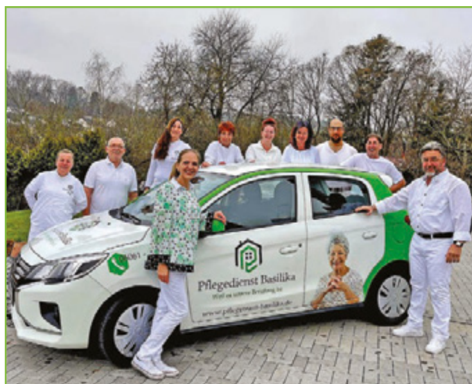
Beim Pflegedienst Basilika wird jeder zu betreuende Kunde gleichermaßen respektiert und akzeptiert.

Michelstadt. Das Team vom jeder zu betreuende Kunde Pflegedienst „Basilika“, betreibt gleichermaßen respektiert und seinen ambulanten Pflegedienst akzeptiert. Ein höflicher und aus Leidenschaft zum Beruf liebevoller Umgang steht hier und es ihm sehr wichtig, diesen auch mit voller Hingabe zu an erster Stelle. Auch die Füh- auszuführen. Beim Pflegedienst nehmen, regelmäßig die Touren selbst zu fahren, da ihnen der persönlichen Kontakt zum Kunden ein wichtiges Anliegen ist. Der Pflegedienst Basilika aus Michelstadt/Steinbach betreut im Umkreis von 15 Kilometern pflegebedürftige Kunden und deren Angehörige. Folgende Leistungen werden angeboten: Grundpflege, Behandlungspflege, Betreuung, Hauswirtschaft, Beratungseinsätze und vieles mehr. Kontakt. Pflegedienst Basilika; Am Hang 16a, Michelstadt, Telefon: 06061-9690187, E-Mail: pflegedienstbasilika@web.de, www.pflegeteam-basilika.de/. pr/ug