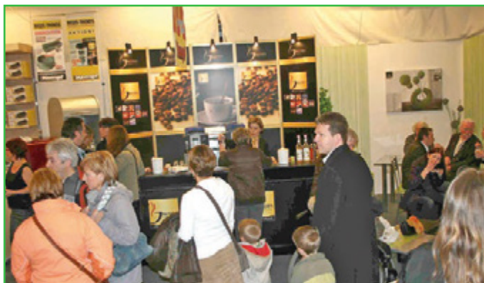
Köstlicher Kaffee und frisch gebackener Kuchen wird in der Kaffeelounge serviert.