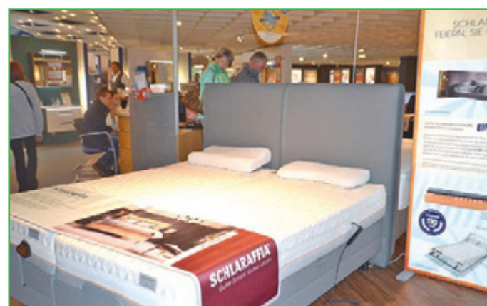
Jedes Schlaraffia Boxspringbett vereint funktionale Schlaf-Technologie mit einer attraktiven Optik.