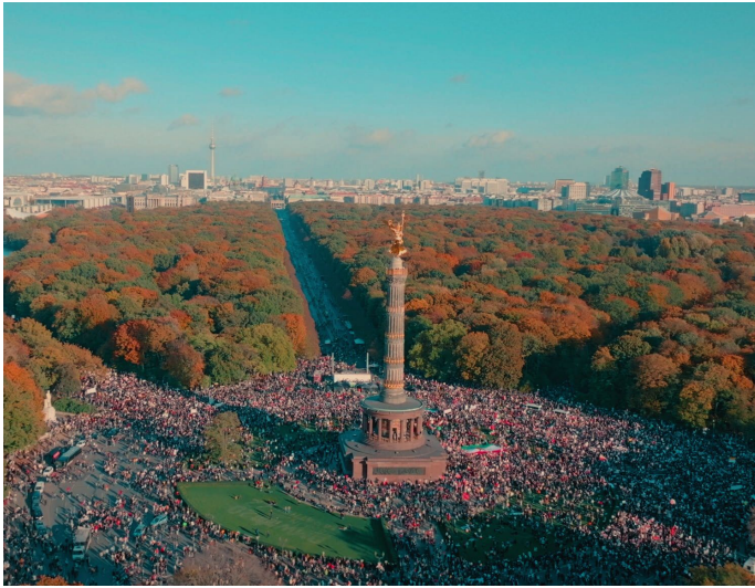
Eine Szene aus dem Film „Freiheit im Herzen“.

Eine Woche später geht es mit dem Film „Im Schatten der Träume“ um ein weitgehend unbekanntes Kapitel der deutschen Musik- und Filmgeschichte. Das Duo Michael Jary (Komponist) und Bruno Balz (Texter) schrieben nicht nur die Musik zu mehr als 250 Filmen und machten Zarah Leander zum Weltstar, sie prägten auch die Nachkriegszeit mit ihren Kompositionen. Die NS-Zeit wird gefährlich für sie, denn Balz, als schwuler Mann, wird verhaftet, aber mit allerlei Tricks kann Jary ihn vor dem KZ retten. Die Kritik beschreibt diese schwungvolle Doku als „kenntnisreich und kurzweilig“. Zu sehen am Sonntag, 27., um 17.45 Uhr und am Mittwoch, 30. April, um 20.15 Uhr. red