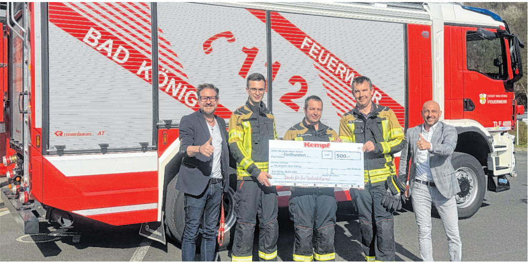
Möbel Kempf bedankt sich bei der Freiwilligen Feuerwehr mit einer großzügigen Spende.