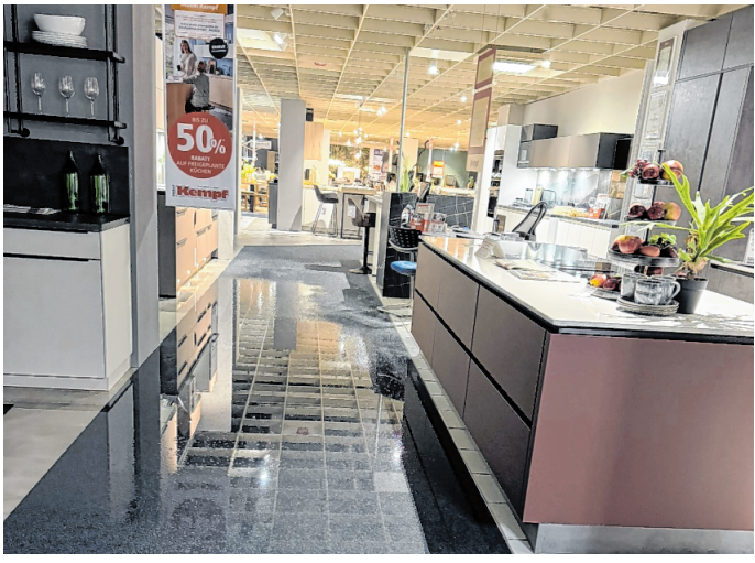
Die Küchenabteilung stand komplett unter Wasser